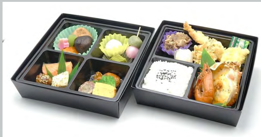
ひとくちデザートの入った DH-300 ～すみれ～ 21cm×21cm 本体価格 3,000 円【3,240 円税込】