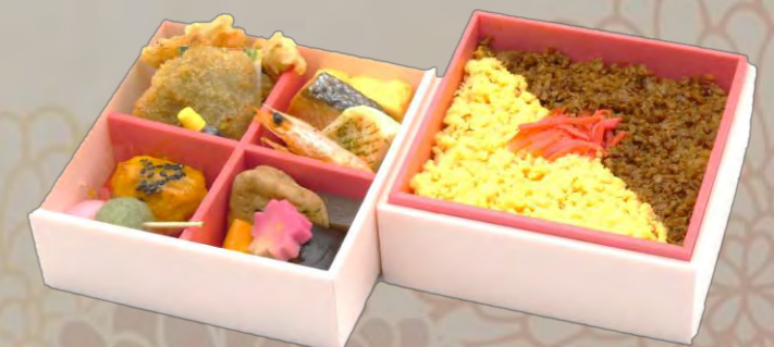
OW-151 華やぎ二段 13cm×13cm 本体価格 1,500 円【1,620 円税込】