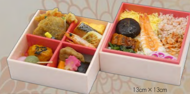
OW-200 海鮮散らし重 13cm×13cm 本体価格 2,000 円【2,160 円税込】