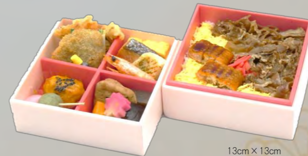
OW-250 すき焼き鰻重 13cm×13cm 本体価格 2,500 円【2,700 円税込】