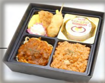
お子様弁当Ⅰ 【幼稚園～小学校 低学年向け】 本体価格 1,000 円 1,080 円【税込】