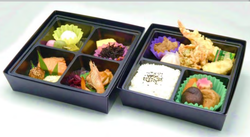
酒肴賑わい御膳 21cm×21cm DH-250 ～ゆり～ 本体価格 2,500 円【2,700 円税込】