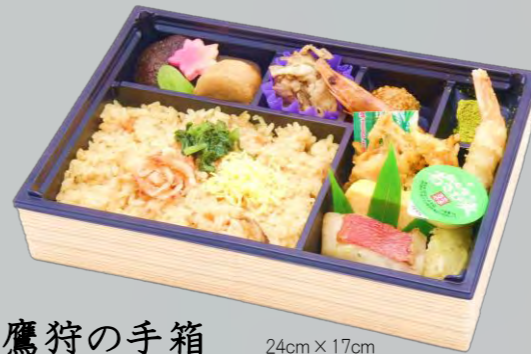
OM-151 鷹狩の手箱 24cm×17cm 本体価格 1,500 円【1,620 円税込】