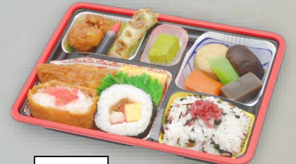
DH-60 助六 23cm×17cm 本体価格 600 円【648円税込】