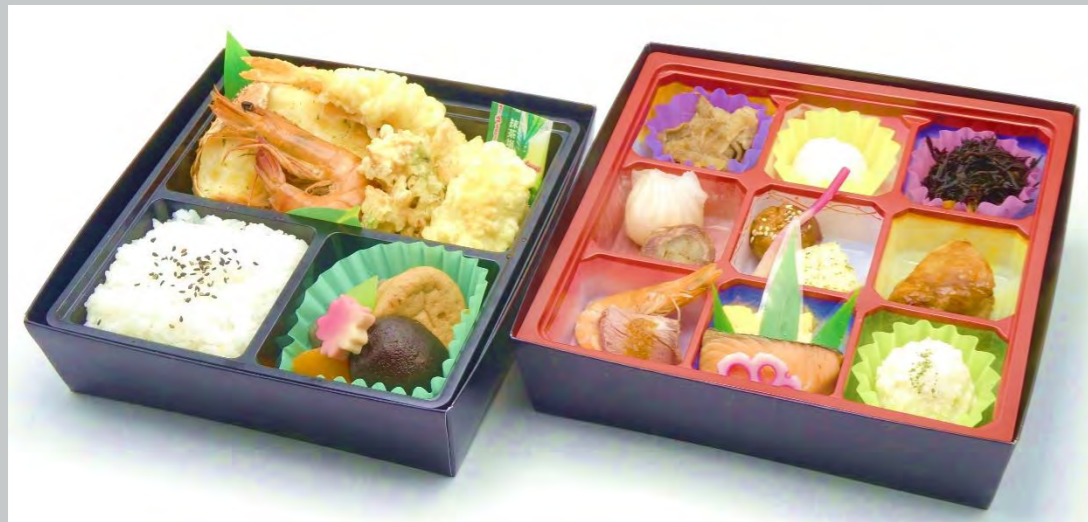
DH-350 ～さくら～ 本体価格 3,500 円【3,780 円税込】