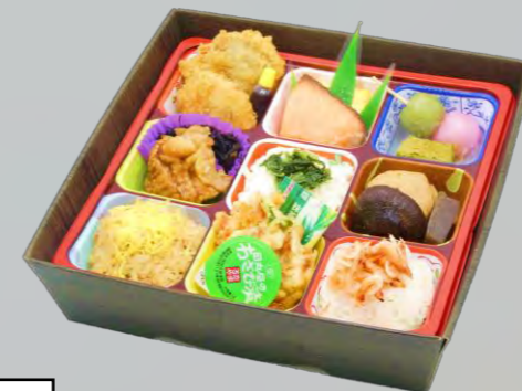
DH-100 静岡味めぐり御膳 21cm×21cm 本体価格 1,000 円【1,080 円税込】