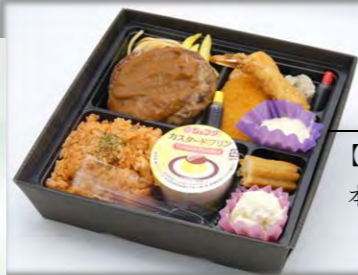
お子様弁当Ⅱ 【小学校高学年向け】 本体価格 1,500 円 1,620 円【税込】