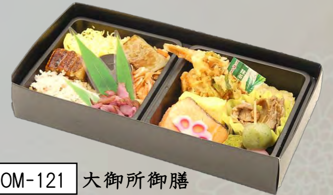
OM-121 大御所御膳 25cm×13cm 本体価格 1,250 円【1,350 円税込】