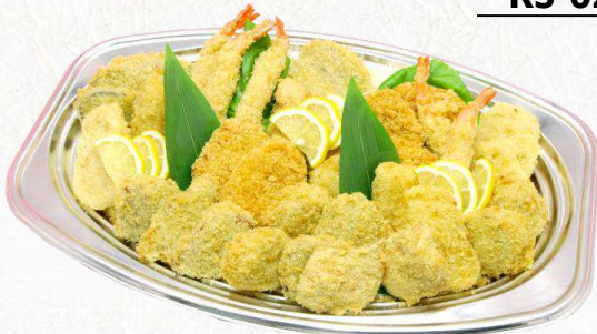
KS-04 フライ盛合せ (434 mm × 285 mm)