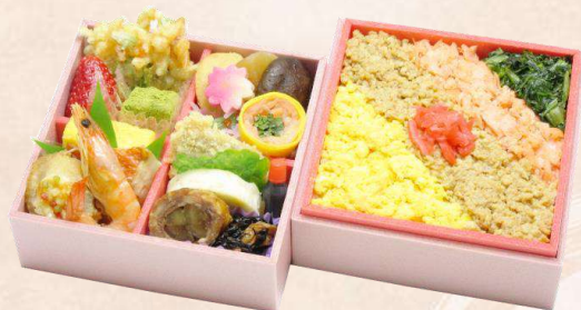
O-1 華やぎ2段 (130 mm × 130 mm) 本体価格 1,500 円 (1,620 円 [税込])