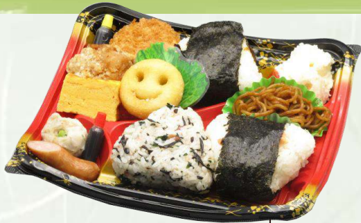
P-4 おにぎり弁当 B