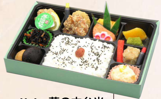
U-4 幕の内弁当 (275 mm × 180 mm) 本体価格 900円 (972円 [税込])