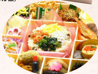
KH-2 花車御膳 ～彩御飯～