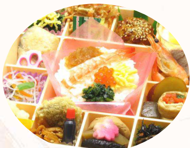
KH-3 花車御膳 ～海鮮散らし～