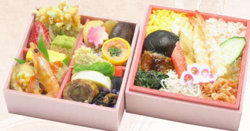
O-7 海鮮散らし重 (130 mm × 130 mm) 本体価格 2,000 円 (2,160 円 [税込])