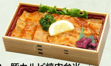
R-8 豚カルビ焼肉弁当