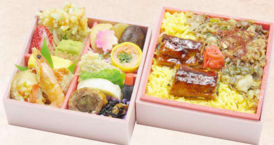
O-7 すき焼き鰻重 (130 mm × 130 mm) 本体価格 2,500 円 (2,700 円 [税込])