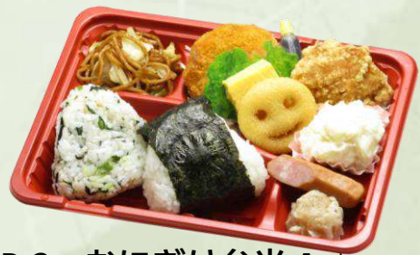
P-2 おにぎり弁当 A