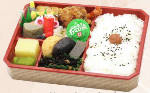
U-2 幕の内弁当 (222 mm × 163 mm) 本体価格 750円 (810円 [税込])