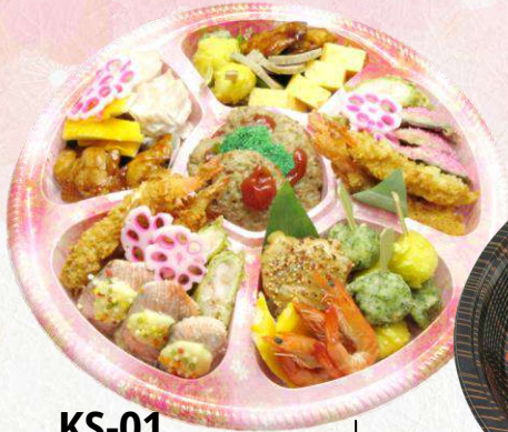
KS-01 和洋オードブル (Φ365 mm)