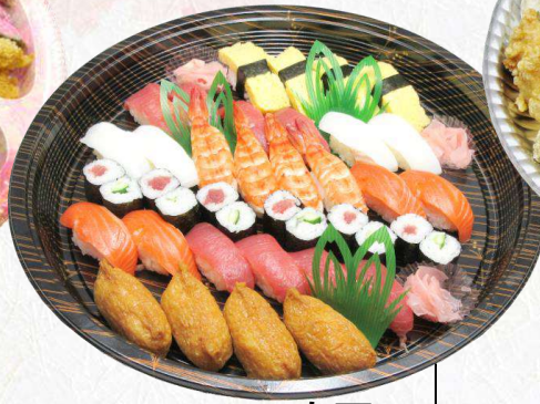
KS-02 寿司 (Φ450 mm)