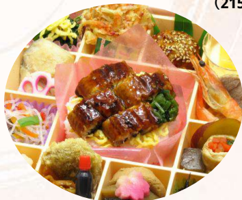
KH-6 花車御膳 ～鰻～