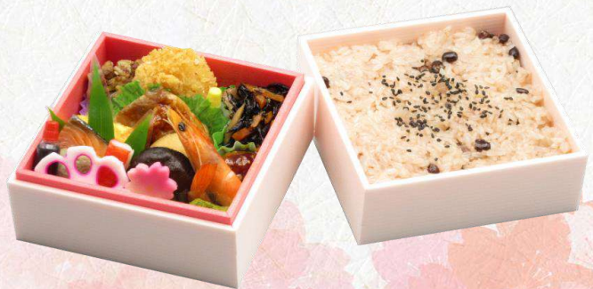
W-4 赤飯弁当~絵あわせ~ (130 mm × 130 mm) 本体価格 1,500 円 (1,620 円 [税込])