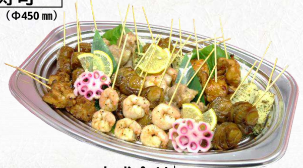
KS-06 串盛合せ (434 mm × 285 mm)