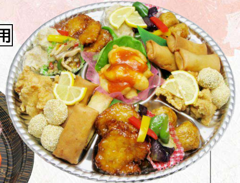
KS-03 中華オードブル (Φ350 mm)