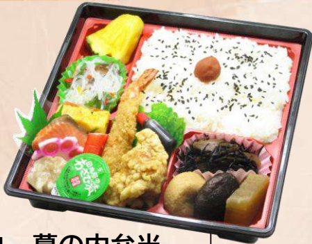
U-1 幕の内弁当 (209 mm × 209 mm) 本体価格 650円 (702円 [税込])