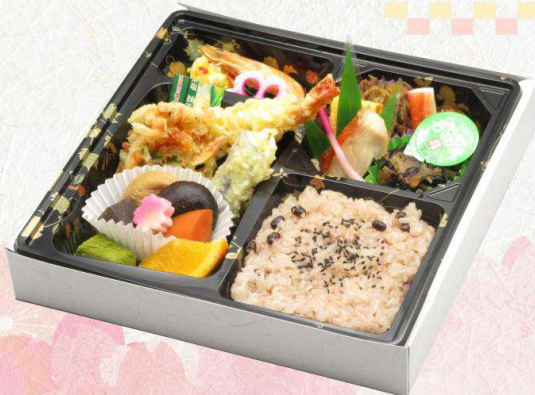
W-6 赤飯弁当~祭りばやし~ (240 mm × 240 mm) 本体価格 1,300 円 (1,404 円 [税込])