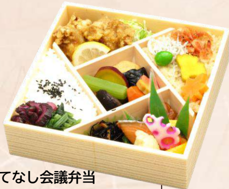
おもてなし会議弁当 Q-6 『味ごよみ』 (180 mm × 180 mm) 本体価格 1,000円 (1,080円 [税込])